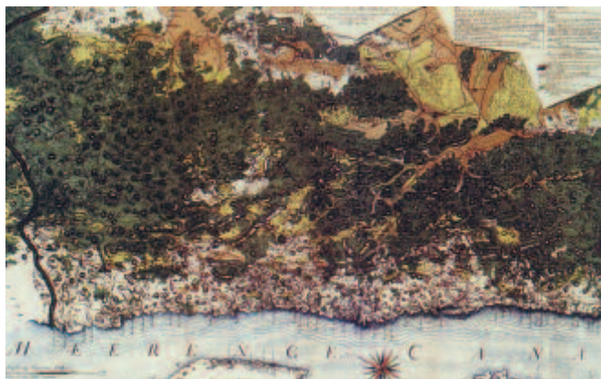
* Karta šuma ličke pukovnije s dijelom priobalja iz 1675. godine na kojoj prevladavaju preborne bukovo-jelove šume (Kosović 1914.)

Šume Republike Hrvatske poznate su i van granica naše države zbog činjenice da je gotovo 95% šuma prirodnog ili poluprirodnog sastava, što je rezultat duge šumarske tradicije održivog gospodarenja ovim prirodnim bogatstvom koja traje više od 250 godina. Već 1765. godine bile su osnovane prve šumarije i usvojene zakonske uredbe o šumskom redu kao temelj organiziranog održivog gospodarenja šumama u našoj zemlji.